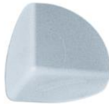
R1888 90x90x90 mm

R1889 Cosmofin PVC külső sarok R1888 Cosmofin PVC belső sarok Kiszerezés: 25 db/csomag