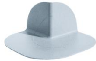
R1889 155x155x75 mm